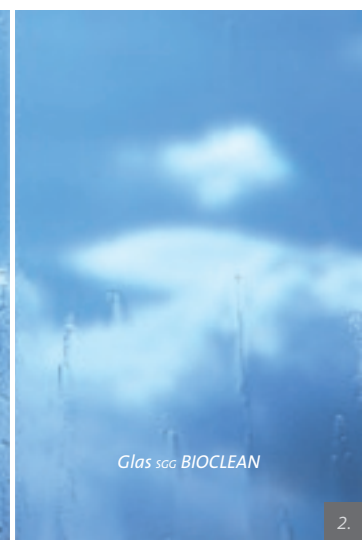
Glas SGG BIOCLEAN